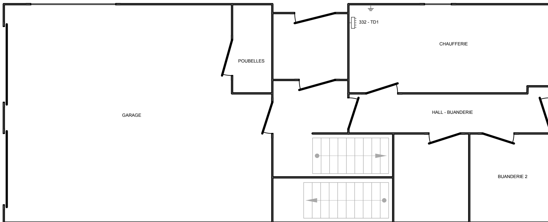
Rez de chaussée - Implantation